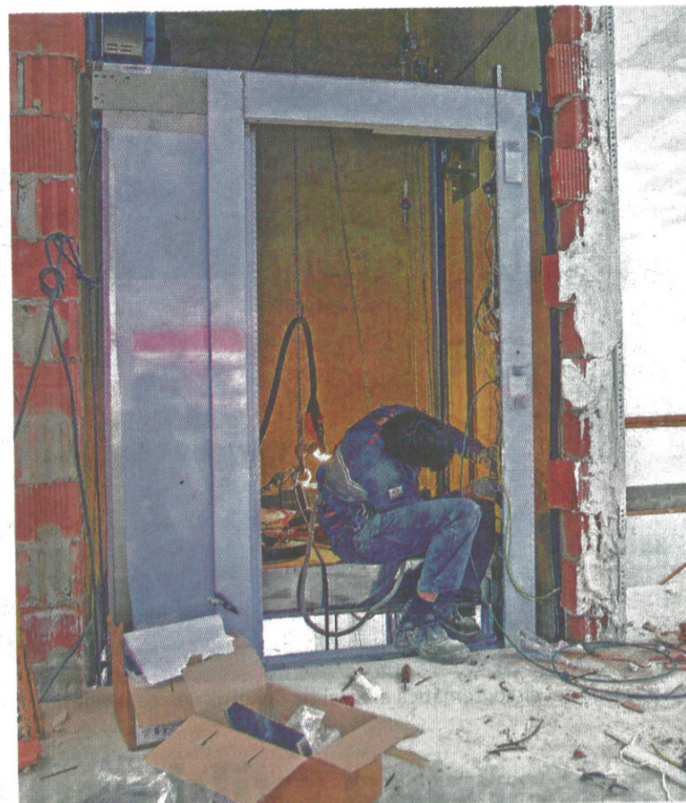
Un operario instala un ascensor en un portal.

En cuanto a la tipología de las ayudas concedidas, el 34,8% de las mismas tuvo que ver con ascensores, mientras que el 22,9% fue para pa-